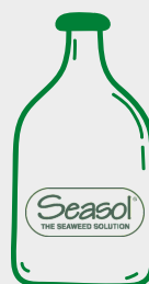
ਸੀਸੋਲ ਪਾਵਰਫੀਡ (Seasol Powerfeed)