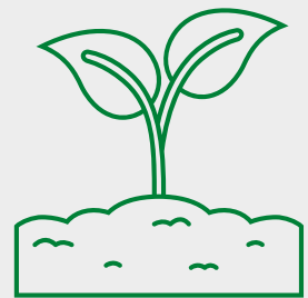
ਪੌਸਦ ਆਂਦੀ ਪਨੀਰੀ